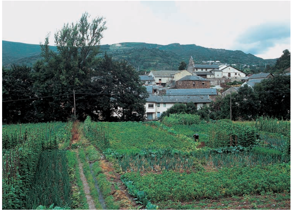
Rioscuro de Laciana desde el mediodía