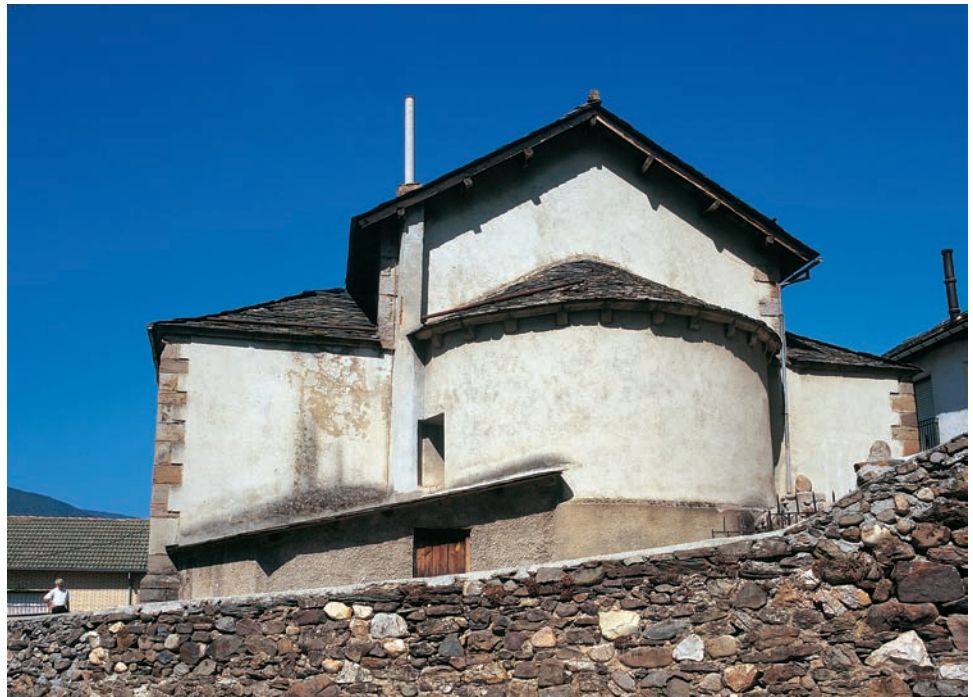
La iglesia vista desde el este