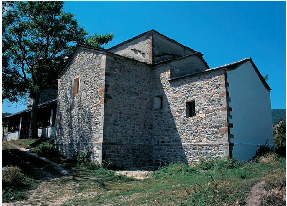
La iglesia vista desde el sureste