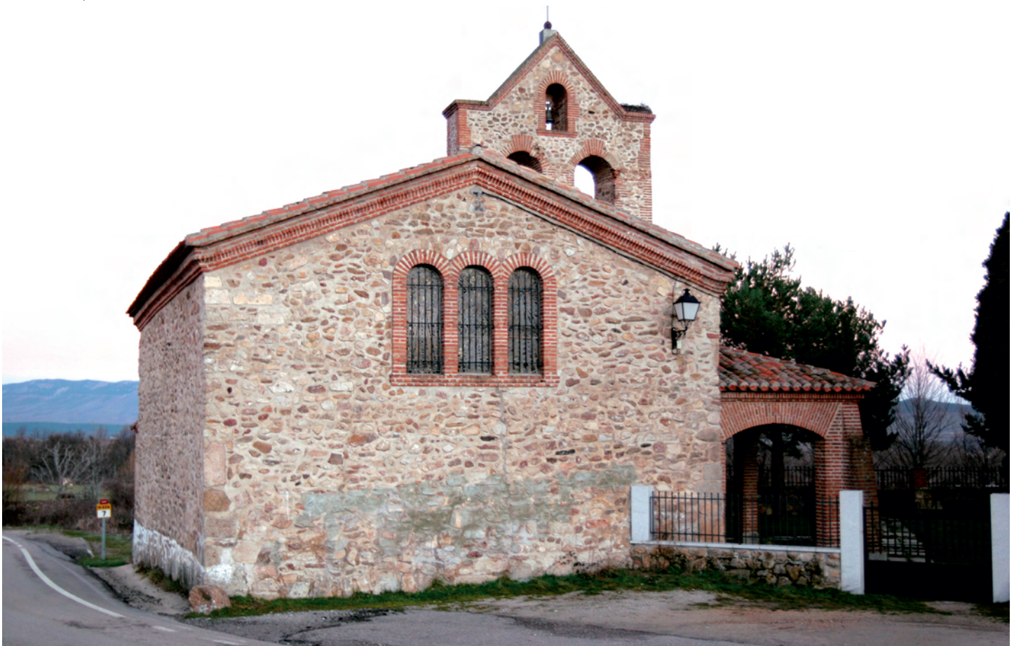
Exterior desde poniente