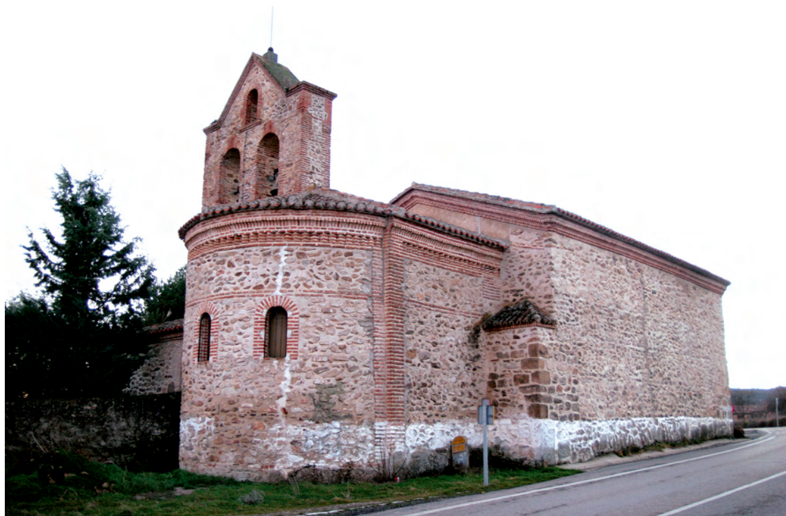
Aspecto exterior desde el Noreste

Se trata de un templo canónicamente orientado, construido en fábrica mixta de mampostería y ladrillo en los ángulos, cornisas y recercado de vanos. Hoy muestra planta basilical de tres naves rematadas en testeros planos al