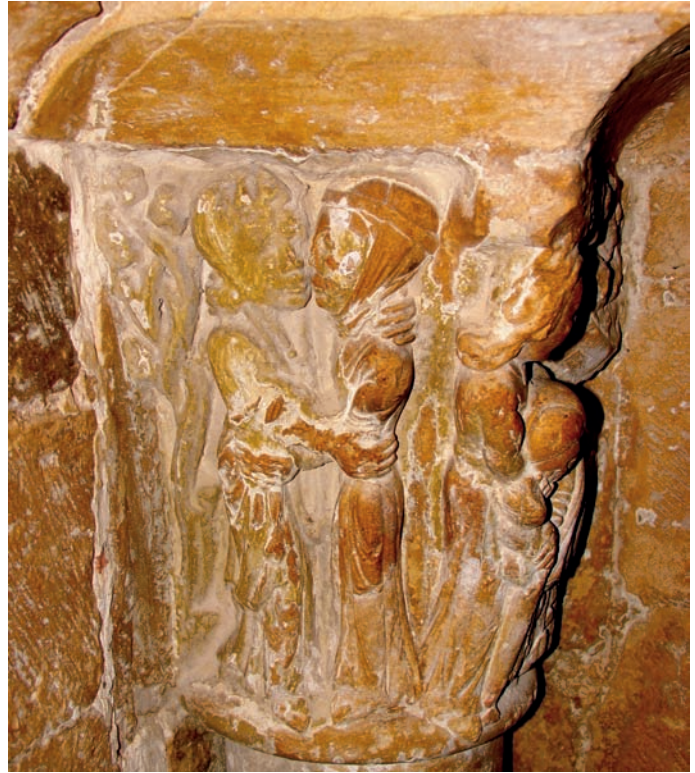
Capitel de la portada románica. Visitación