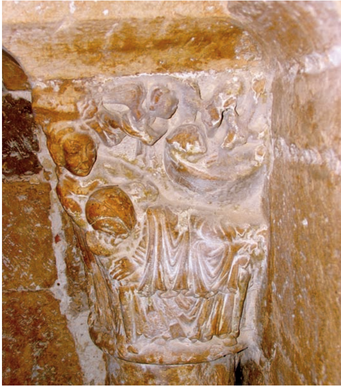
Capitel de la portada románica. Nacimiento