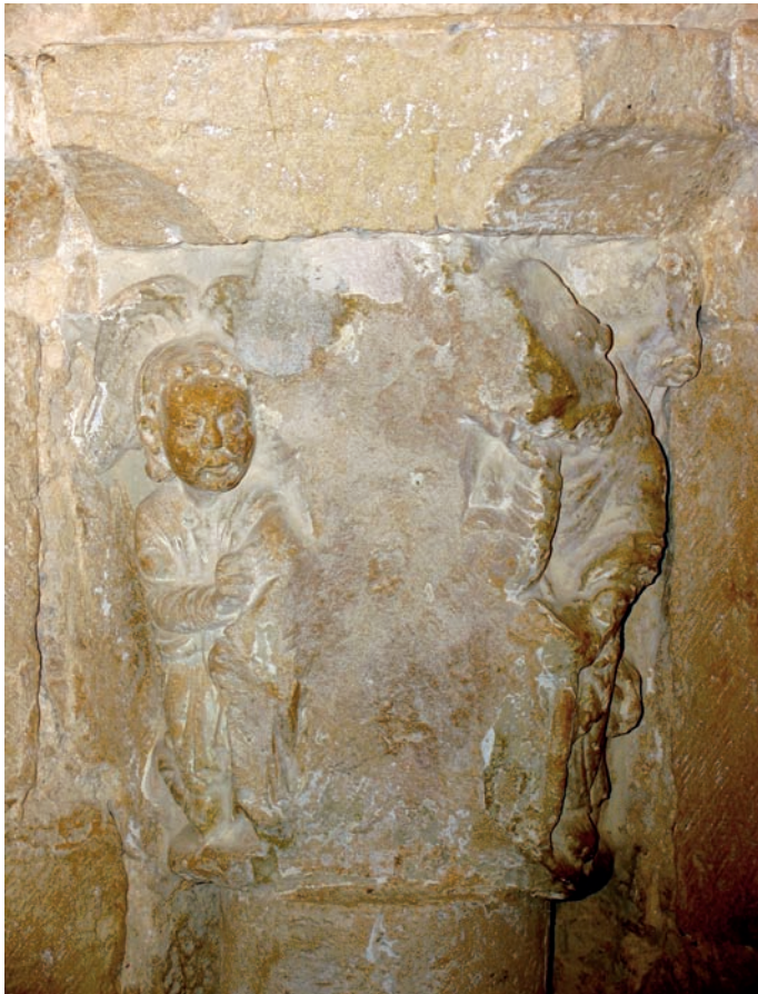
Capitel de la portada románica. Anunciación

silense, con lo cual resulta factible pensar en su influencia en Lezáun. Eguiarte y Azcona aunque, eso sí, pasando por la portada de San Miguel de Estella.