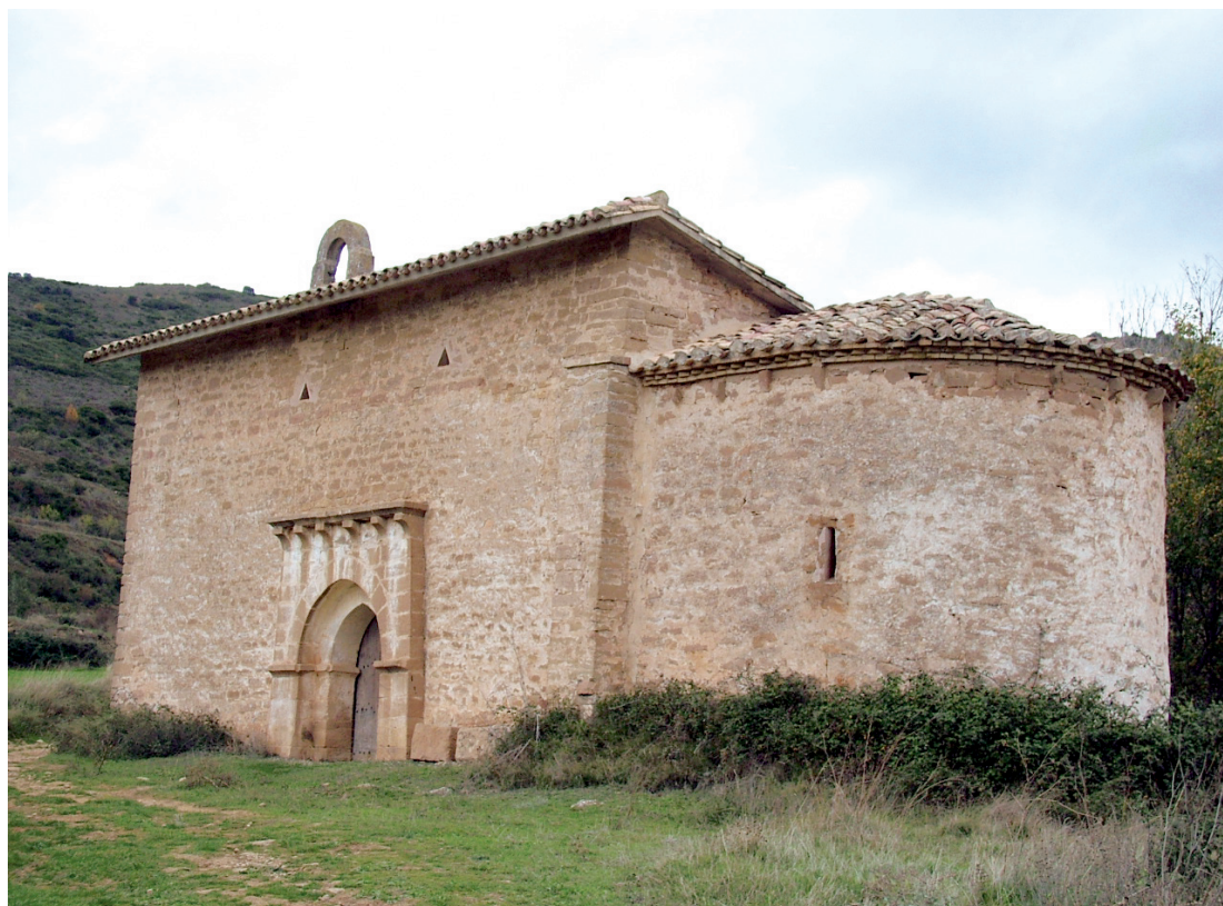
Vista de la ermita de Nuestra Señora de Leorin desde el lado sureste

Según el Libro del Monedaje de tierras de Estella de 1350, la población de Morentin estaba compuesta en su totalidad por hidalgos, pero no ha quedado testimonio de su número. Años