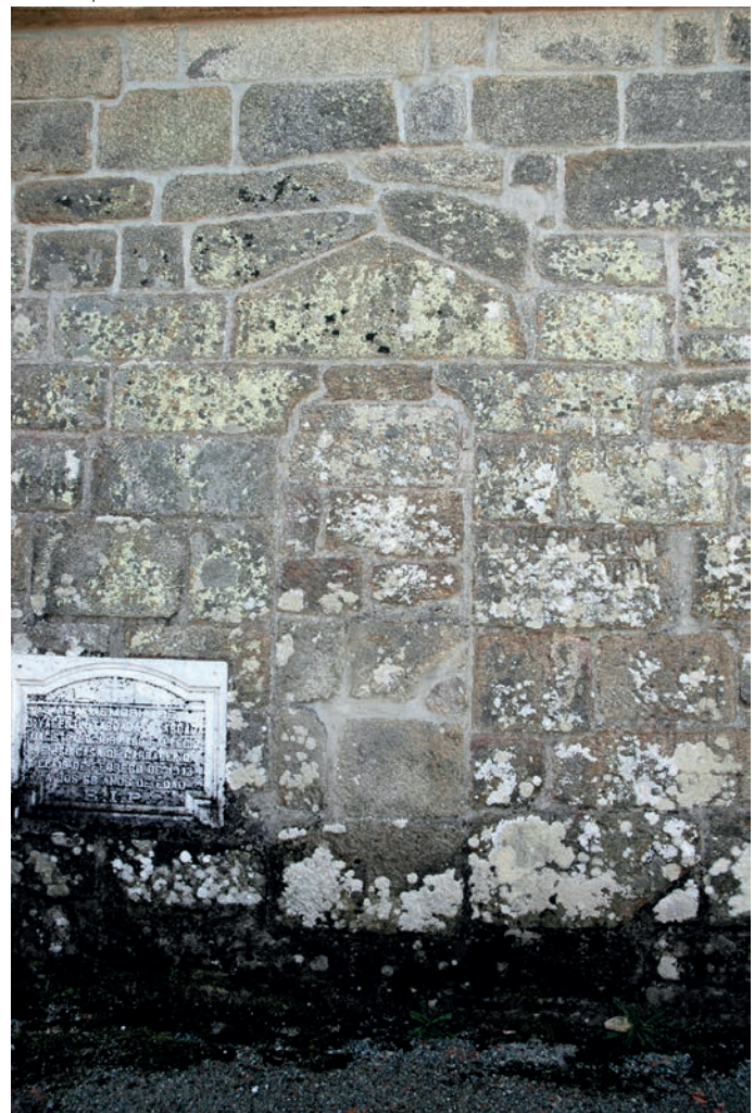
Puerta tapiada en el muro norte de la nave

Ourense en el período comprendido entre los años 1174 y 1213. Este personaje destacó por su afán constructor durante su mandato y participó en la consagración de numerosos templos. Este mismo obispo también participó en el acto de consagración del altar mayor de la catedral de Ourense (1188), junto con el arzobispo de Braga y los obispos de Lugo