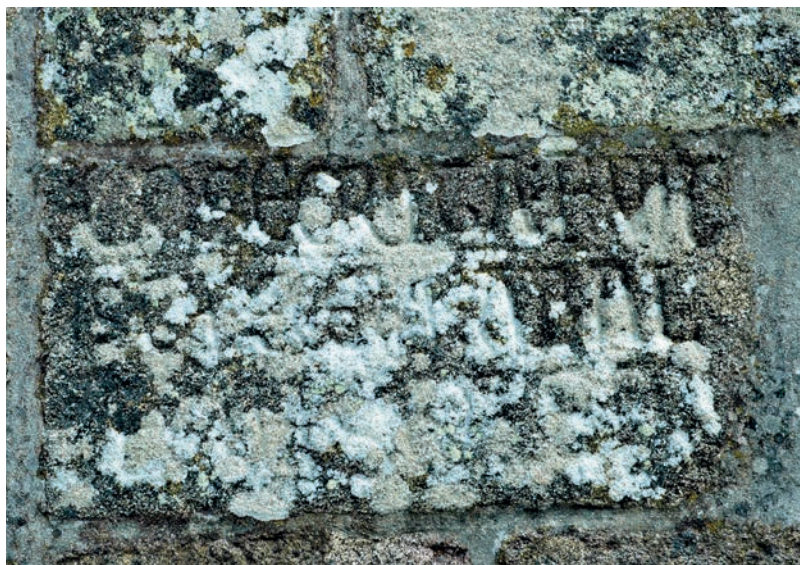
Inscripción del muro norte de la nave