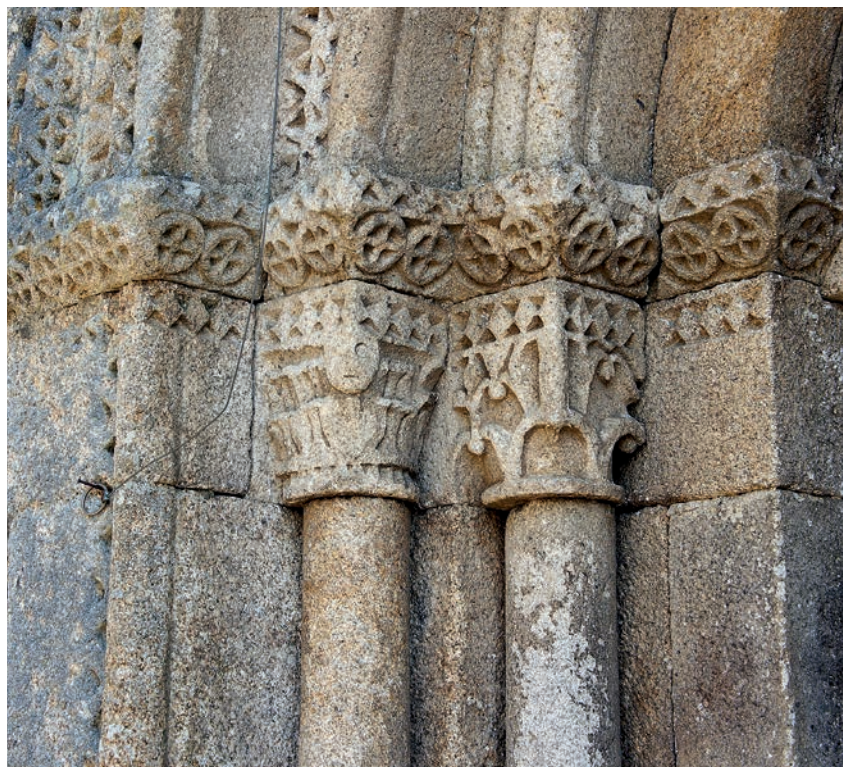
Capiteles de la portada oeste

aún con los añadidos que han modificado la estructura original, hace que San Pedro de Boado sea un buen ejemplo de la estética recurrente de los talleres que trabajaban en la provincia durante el primer cuarto del siglo XIII.