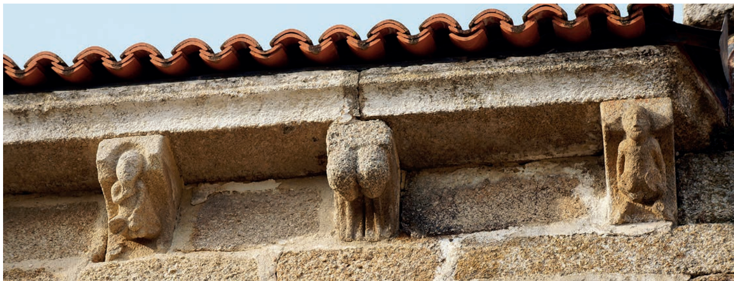
Canecillos del muro sur de la cabecera