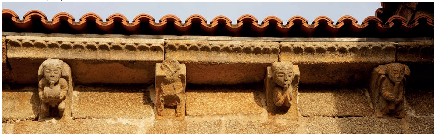
Canecillos de la capilla gótica

siendo imposible, sin embargo, determinar si tendría un acceso a este lado o no. La cornisa se compone de cobijas en nacela lisa y de cuatro canecillos –los restantes han desaparecido tras construirse la capilla gótica– con decoración geométrica.