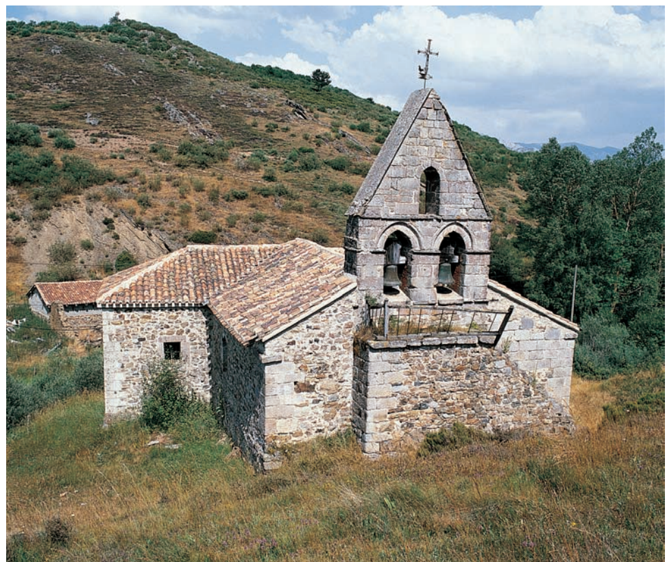
Nuestra Señora de la Asunción