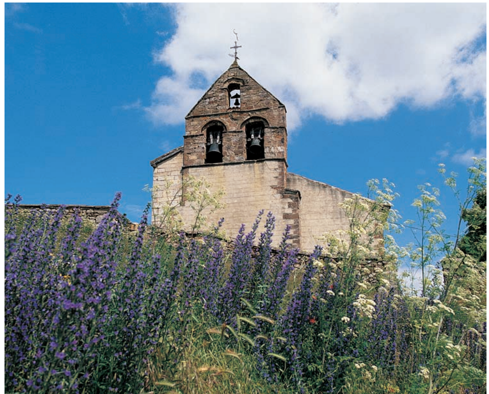
Nuestra Señora de la Asunción

Del templo medieval sólo nos ha llegado la sencilla espadaña –realizada en mampostería– que se ubica a los pies de la iglesia. Responde a la tipología habitual de la zona con