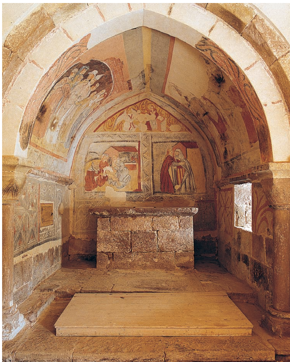
Interior después de la última restauración

Curiosamente este tipo de ermitas románicas aparecen a menudo aisladas sobre un altozano, fuera del núcleo habitado. Son por lo general edificaciones extremadamente toscas y pobres pero muy homogéneas en su construcción ya que debieron levantarse en un corto período de tiempo. Este carácter tan humilde parece estar en relación con las posibilidades económicas y con las exigencias litúrgicas de la comunidad. El culto habitual se celebraba en la iglesia parroquial y sólo en determinadas festividades se acudía a la ermita.