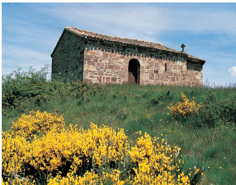
Ermita de Nuestra Señora del Valle

La nave se cubre con techumbre de madera a doble vertiente y la capilla absidal con bóveda de cañón apuntado