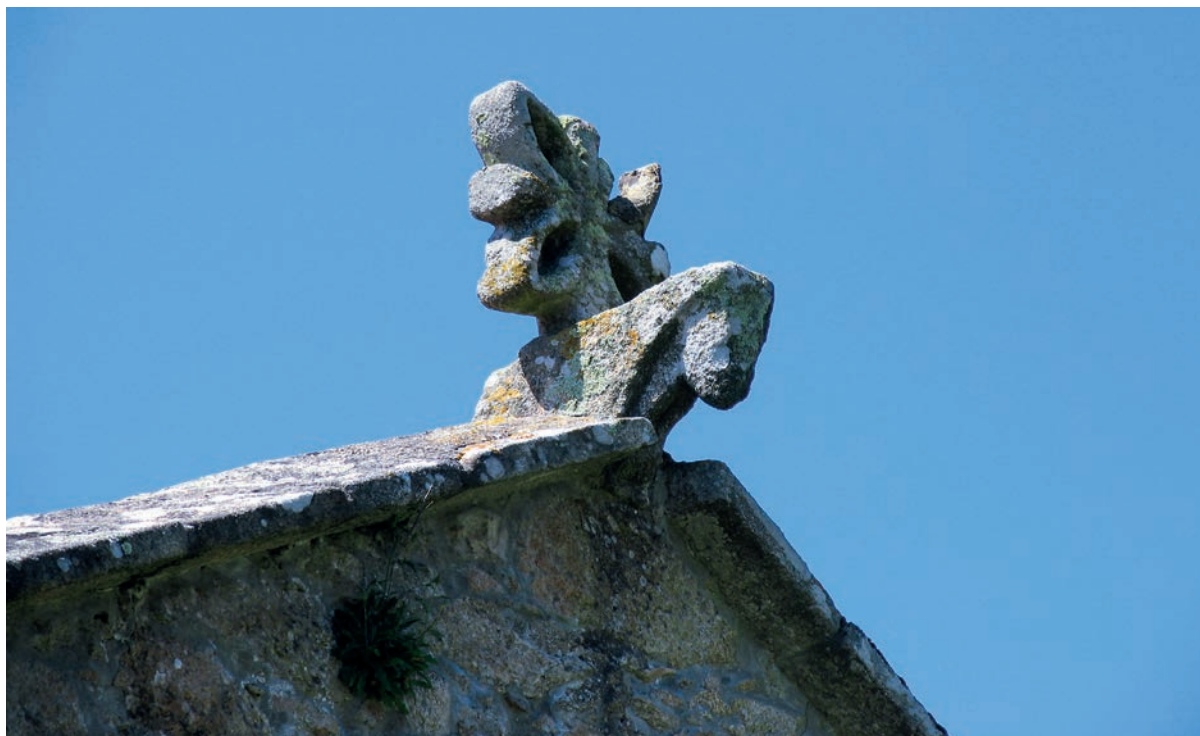
Antefija del testero

ro de ellos y se eliminó gran parte de la cobija de chaflán recto— son de proa, en nacela simple o con decoración de perlado, de rollos o baquetillas y de cabezas de bóvidos.