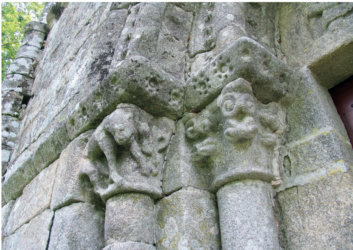
Capiteles de la portada occidental