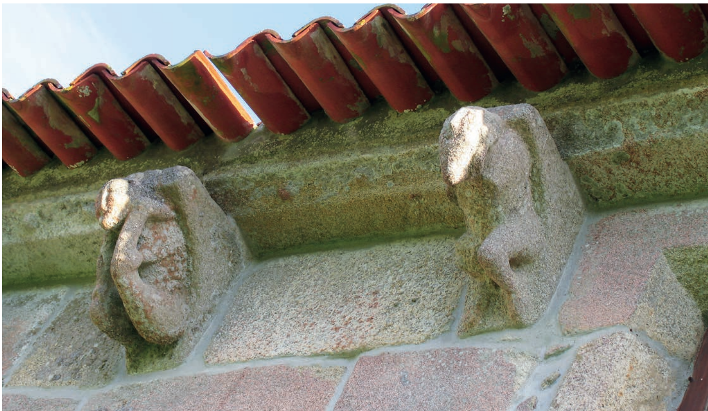
Canecillos del muro norte. Exhibicionistas