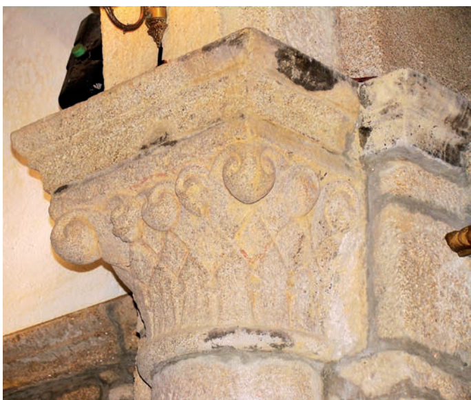
Arriba, canecillos del muro norte. Abajo, capitel del arco triunfal

nolítico liso con capiteles de dos filas de hojas con pomas y basas áticas.