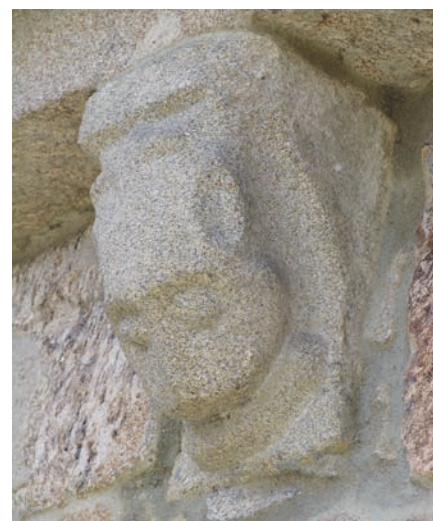
Canecillos de la cornisa meridional del ábside

El alero presenta cobija en nacela lisa que carga sobre una docena de canecillos, seis en cada lado. Entre ellos podemos distinguir una cabeza fitoforme, cinco cabezas de animales, felinos y aparentemente équidos, y seis de decoración vegetal, de flores de pétalos abullonados y botón central y hojas simples. Los de la nave, uno en cada lado, poseen el mismo esquema de dos líneas en quiasmo, en cuya parte inferior o superior hay decoración floral.