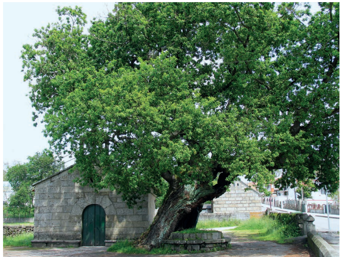
Vista general del edificio

De la fábrica románica se conservan los aleros del ábside y dos canecillos reutilizados en el muro de la nave tras su reconstrucción de 1987.