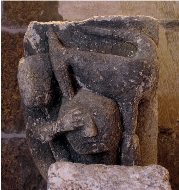
Capitel del interior

encastrado en un hueco del muro de la sacristía. Se trata de un capitel en esquina, aunque es historiado. Sobre el collarino apoya sus patas un mono que ocupa uno de los frentes, la cola se vuelve sobre su lomo y con una de las garras tapa uno de los ojos de una cabeza humana que ocupa la parte inferior de la arista. El rostro humano presenta unos rasgos muy rudos, una simple incisión marca la comisura de la boca y un triángulo indica la nariz. Desde el otro lateral el hombre es atacado por un ave que clava el pico en su frente. El pájaro presenta unas características peculiares, una cresta apuntada en el cogote, el ala en forma de abanico pegada al cuerpo, una larga cola se vuelve sobre el lomo del mismo modo que sucedía en el primate, las patas corpulentas que, aunque a primera vista parecen largas, no arrancan desde el collarino, sino que se apoyan sobre un elemento intermedio. La cresta en el cogote lleva a pensar que el ave representada sea una abubilla, animal que aparecía dentro de los difundidos Bestiarios . El hecho de que se represente concretamente la abubilla, ave con unas características fisonómicas tan peculiares, en lugar de un pájaro tipo, hace plantearse que el capitel haya sido tallado como ilustración de un texto o sermón concreto relativo a los tormentos del hombre pecador.