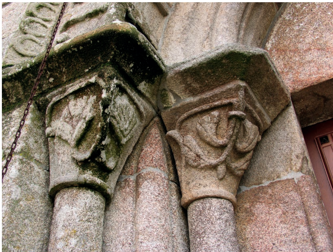
Capiteles de la portada occidental

Por encima de esta línea de canes se abre una saetera en la parte central. La vertiente occidental se realiza a dos aguas y sobre el piñón se sitúa una espadaña con tronera doble de arcos de medio punto. Perfilando la curva de las troneras se dispone una moldura decorada con bolas. Hay una escultura situada en la enjuta central, la cual, aunque por su carácter tosco pueda parecer románica, corresponde a una pequeña intervención posterior en el campanario que se retocó empleando los materiales originales. El piñón de la tronera está coronado por una cruz.