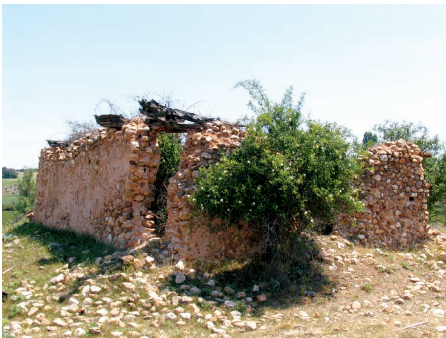
Vista desde el noroeste

pequeño edificio de una sola nave, construido con calicanto y de cabecera semicircular, siguiendo un esquema muy repetido en la provincia entre los edificios de estas características.