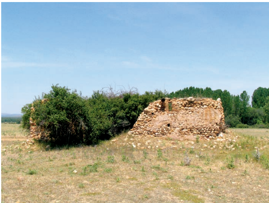
Vista desde el sur