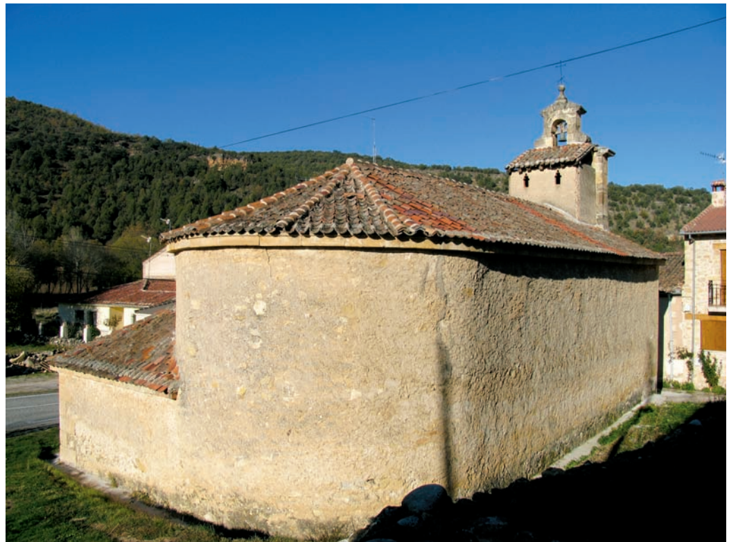
Vista desde el noreste

norte y oeste, el espacio que separa sus muros de algunas viviendas es relativamente estrecho. Es una pequeña iglesia de cabecera semicircular, con la peculiaridad de estar orientada al sur, una sola nave, y sacristía de planta cua-