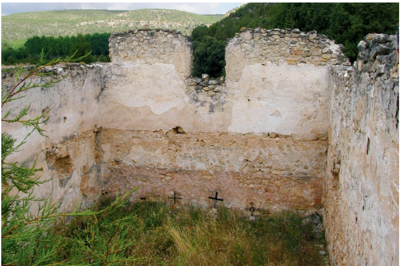
Interior de la nave hacia el bastial occidental