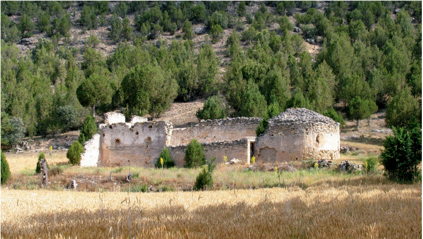
Vista desde el sur

este edificio hubiera un pequeño asentamiento de población conocido como "La Vega".