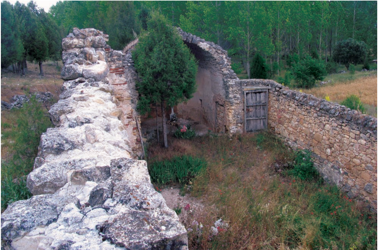
Interior de la nave hacia la cabecera