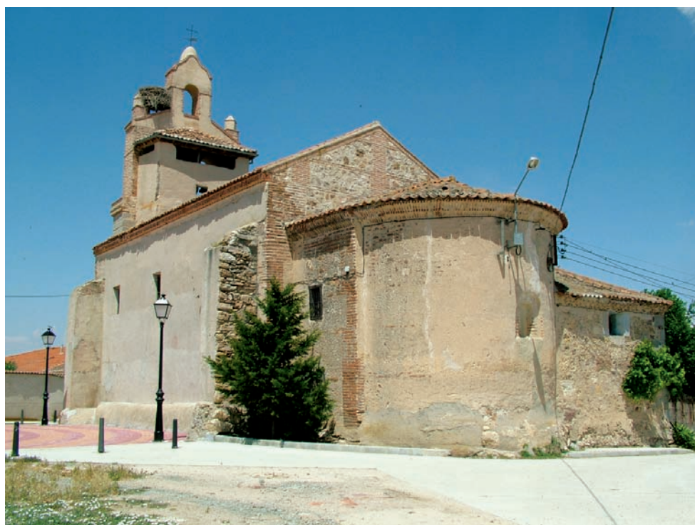
Vista exterior del templo

un tanto peculiar. Aunque la actual iglesia data del siglo XVIII, su origen románico queda patente en la portada y en la cabecera. El primero de los elementos se oculta tras un atrio cerrado. Son varias las capas de pintura que ocultan las tres arquivoltas apuntadas de ladrillo sobre impostas de