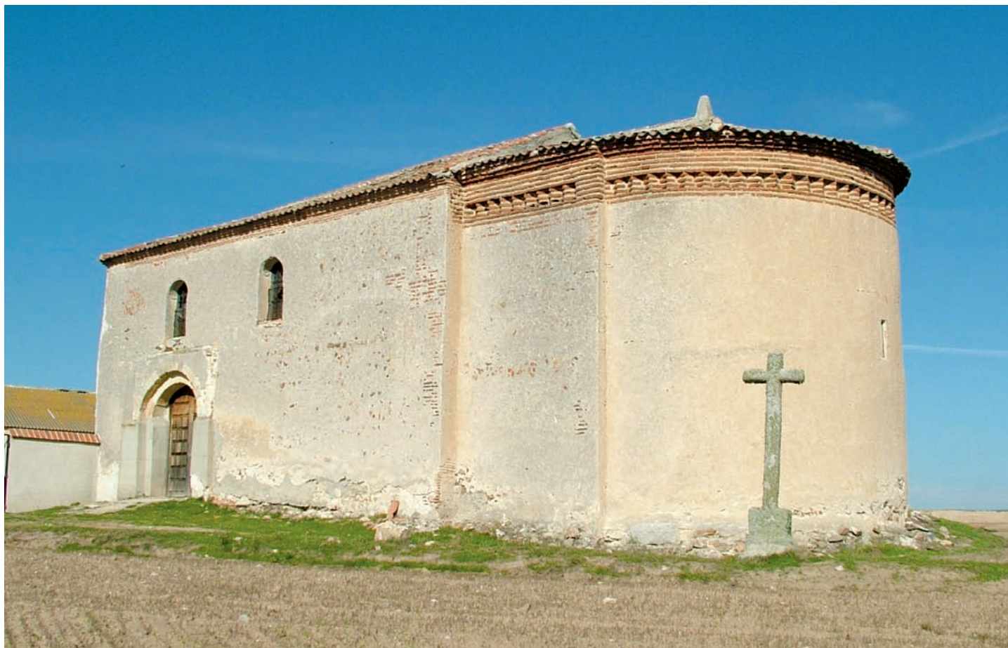
Vista desde el sureste

La ermita de Santa María Magdalena fue elaborada en mampostería de pizarra y completamente enfoscada tanto