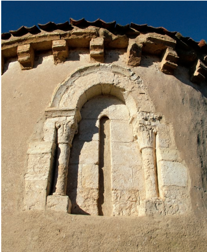
Ventana del ábside