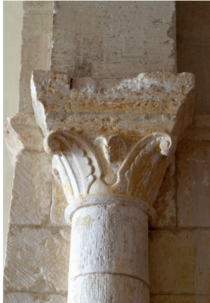
Capitel arco triunfal

El tramo recto de la cabecera está cubierto por bóveda de cañón apuntado dividida en dos tramos gracias a la presencia de un arco fajón que es sustentado por la línea de imposta con perfil de gola que descansa sobre dos machones de granito salientes de los muros. En el muro norte se abrió una puerta de acceso a la troje, dentro del cual, se descubre la ventana de rasgos similares a la situada en el muro paralelo del presbiterio, aunque ha sido cegada y retallada la chambrana.