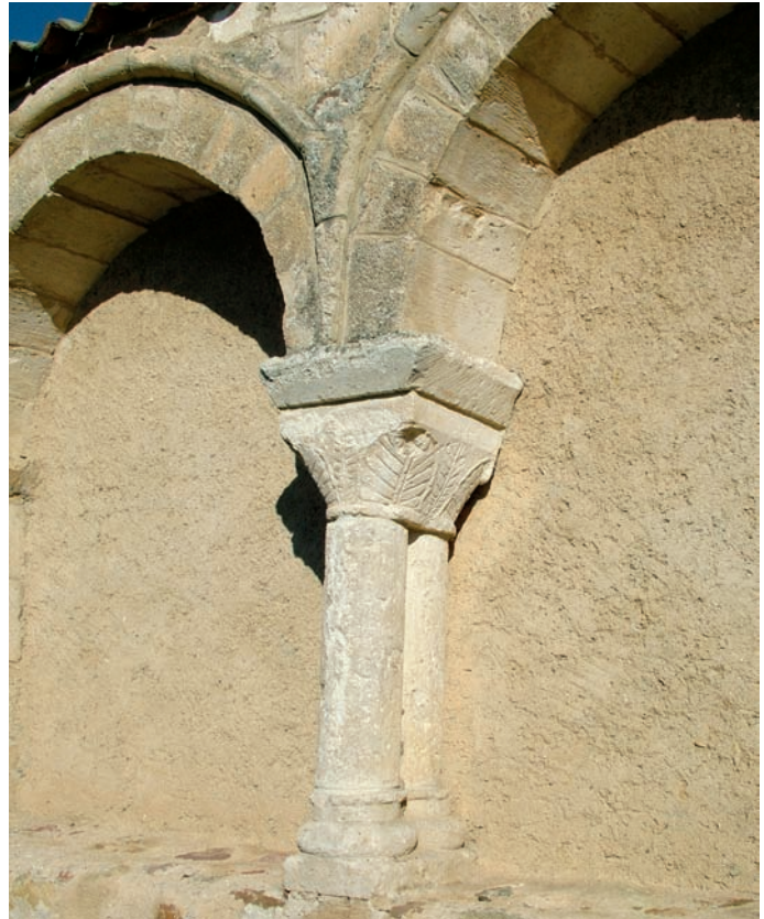
Pórtico. Arquería y capitel