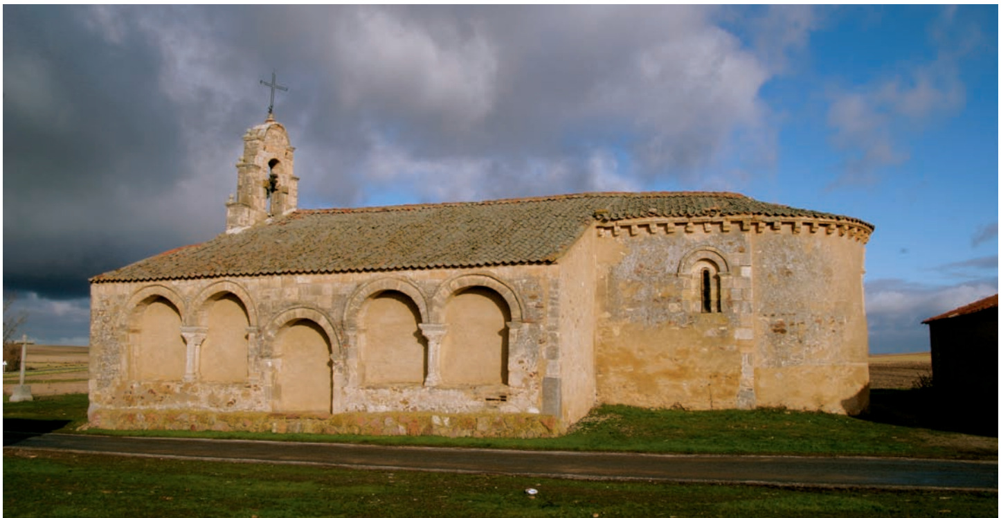
Vista desde el sur

Cuenta con una planta sencilla con cabecera de ábside semicircular y tramo recto. En cierto momento la fábrica sufrió la más importante de las intervenciones, ya que, el atrio porticado situado al sur pasó a ser parte del inte-