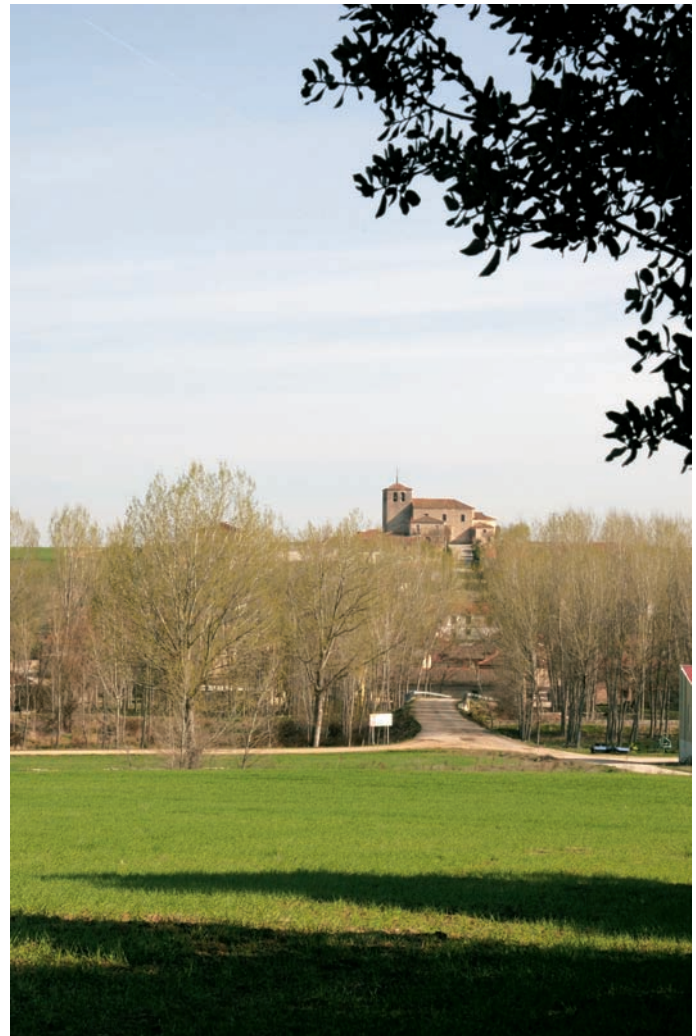
Panorámica de Villavela de Pirón

Tan sólo conservamos de la fábrica original románica la cabecera y la portada. La cabecera como ya hemos dicho está compuesta por ábside y presbiterio y construida con mampostería enfoscada a excepción de los esquinales en los que se emplea sillería y en la cornisa achafla-