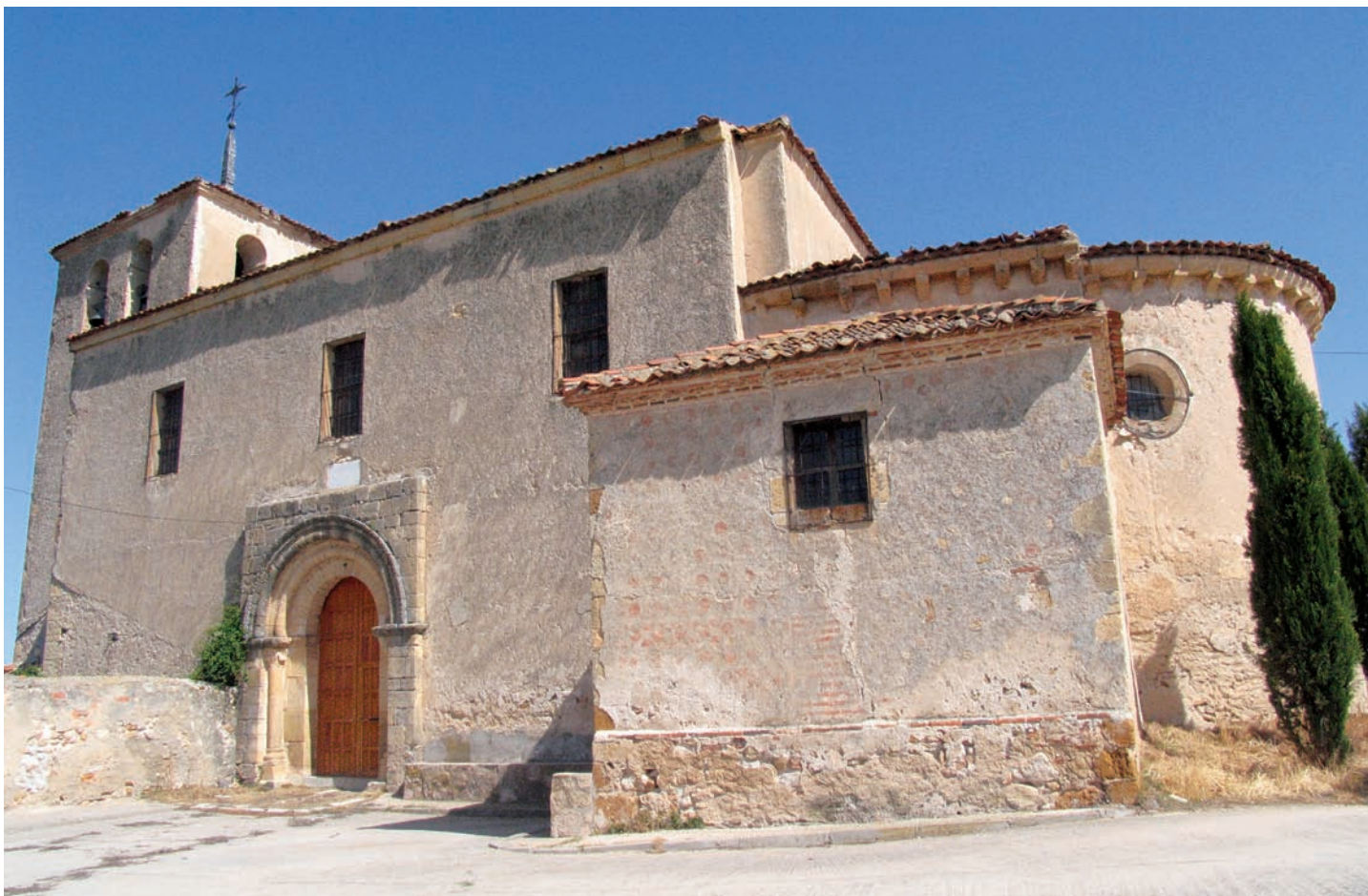
Vista desde el sureste