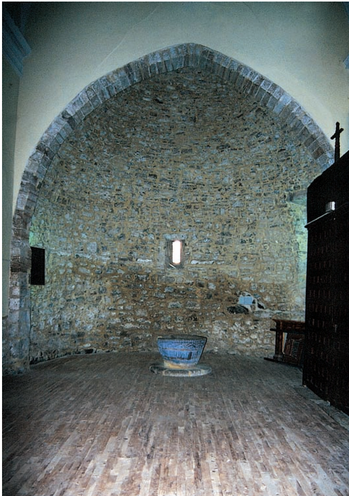
Antigua capilla mayor

la parte superior de sus muros corría una imposta que fue picada en el momento en que se colocó el retablo mayor.