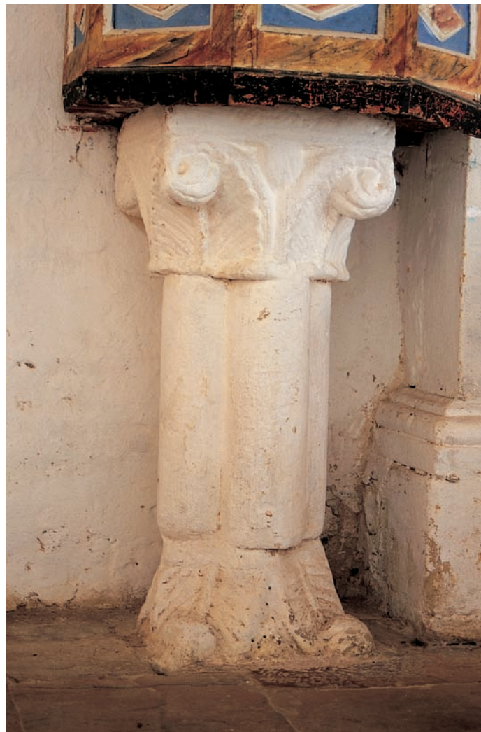
Soporte del púlpito