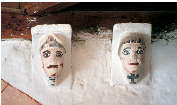
Canecillos colocados sobre el arco triunfal

y de cronología imprecisa, pero de gran interés por cuanto es, junto con el sitial de Pozalmuro, la única pieza románica de estas características conservada en la región.