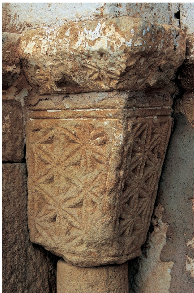
Capitel del pórtico

En el presbiterio hay un antiguo sitial labrado todo él en un solo bloque de piedra. La mitad inferior es maciza y se decora con sencillas molduras aboceladas, mientras que en la parte superior se vació el asiento. Es una obra tosca