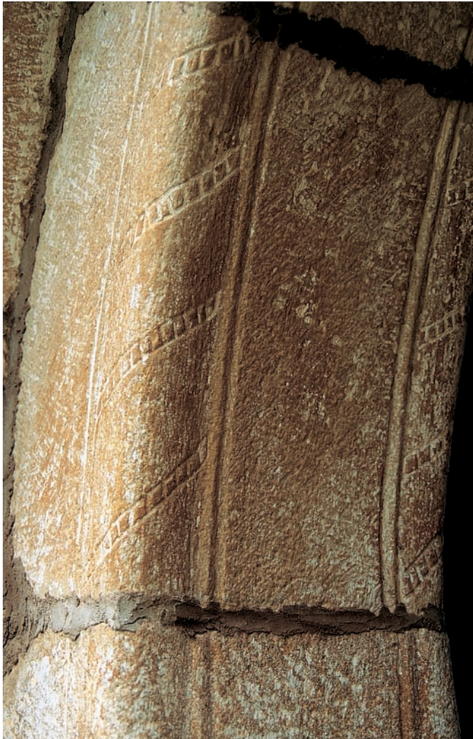
Detalle de la portada

como es habitual se dispone en el lado meridional. Consta de un cuerpo saliente de sillería en el que se abren tres arquivoltas de medio punto, dos lisas y otra con un bocel en el que se enroscan finas bandas de contario. Coronando la portada se disponía un tejeroz con cuatro canecillos también de nacela que alternan con otros tres de perfil convexo.