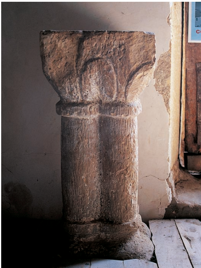
Pila de agua bendita