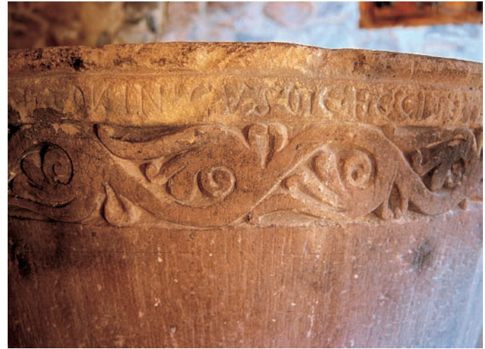
Detalle de la pila bautismal