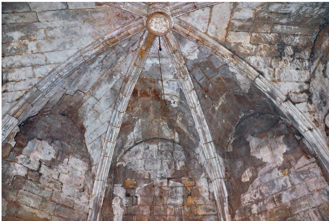
Bóveda gótica de la iglesia

del siglo XIV se llevó a cabo una importante intervención en el sector este del edificio que supuso la sustitución de la cabecera plana por la actual, de planta poligonal y resuelta mediante bóveda de crucería, tal y como sucede en la iglesia parroquial de Caseres. Presenta, además, una altura superior de dos metros al resto del edificio. Sobre este cuerpo se yergue una pequeña espadaña que alberga dos aberturas para las campanas.