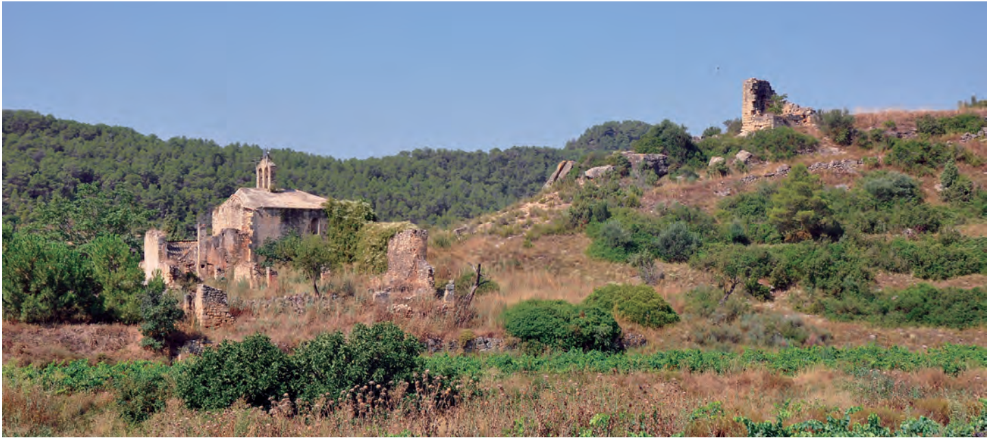
Restos del castillo y de la iglesia