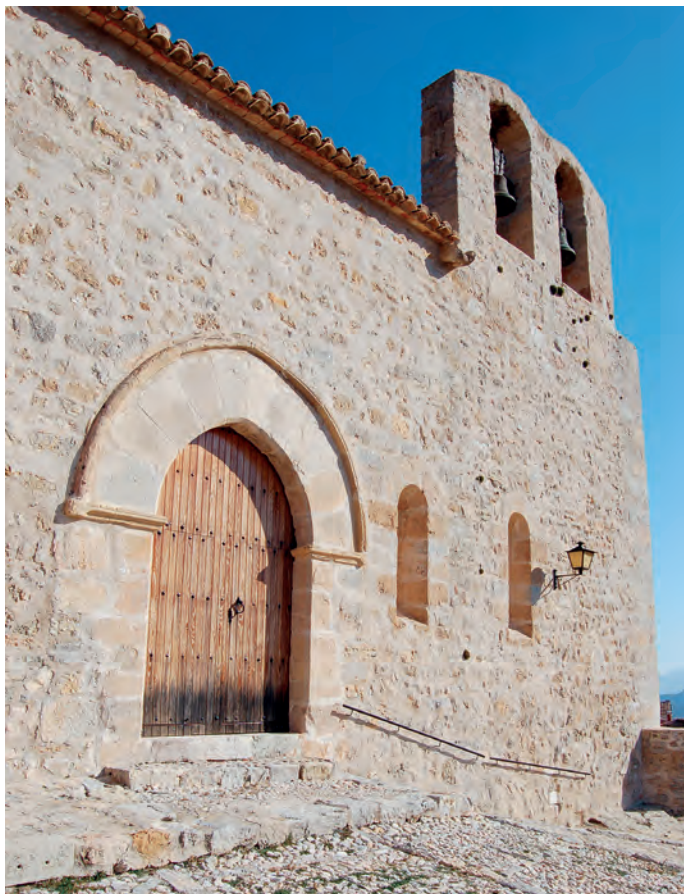
Detalle de la fachada meridional

da de crucería. Recientes excavaciones determinaron que la sacristía se construyó sobre el lugar donde pudo elevarse la torre del castillo. En la misma sala se conserva una base pétrea cuadrangular decorada con cuatro leones en sus extremos a la que se engarzó una pila gallonada datable hacia 1600. Las excavaciones sugieren que el arranque de la fachada principal se corresponde con los restos de un primer edificio de época islámica –o incluso anterior– y que el testero oriental se alzó en dos fases, con aparejo de viejo opus spicatum y mampostería regular de cronología más tardía.