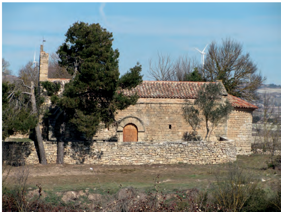
Vista desde el lado sur