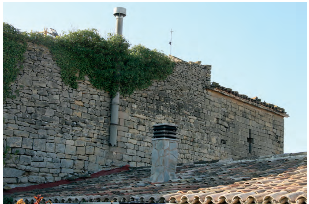
Muro del antiguo castillo

Ya en 1080 existen noticias de la existencia del lugar de Guialmons ( Gisalmon ), insertas en una donación llevada a cabo a favor del castillo de Rauric; el lugar perteneció a la