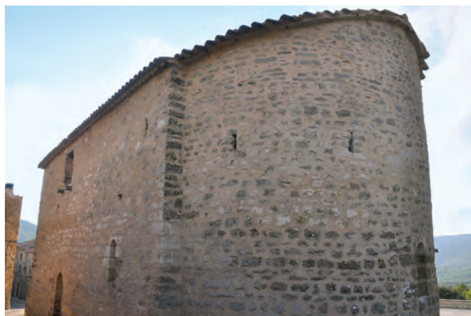
Vista desde el lado sureste