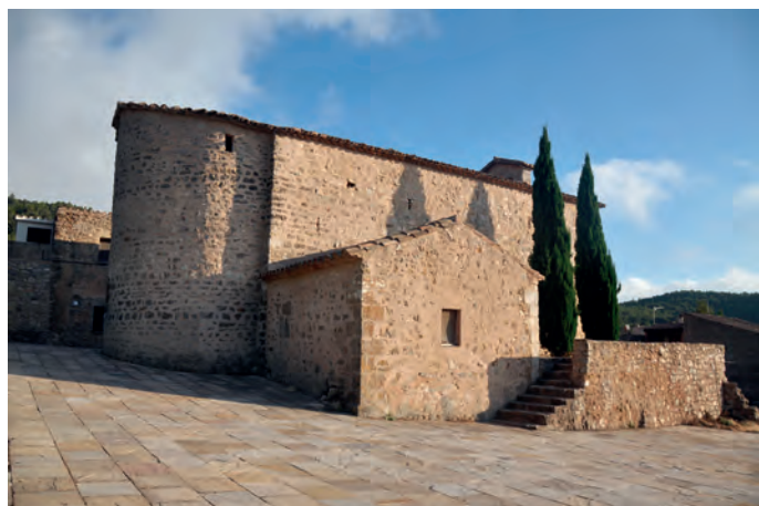
Vista desde el lado norte