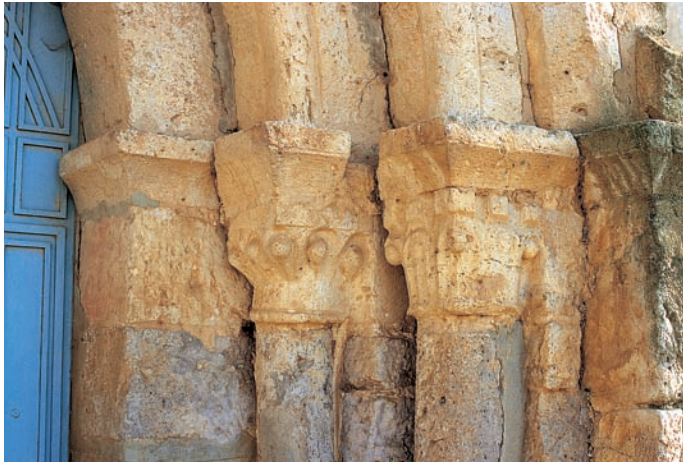
Capiteles de la portada

La cronología de esta portada debe rondar los años finales del siglo XII o los iniciales de la siguiente centuria.