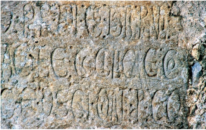
Detalle de la inscripción

aquí en honor de [San Julián] y aquí están guardadas están ( sic ) [sus reliquias y las de] San Pablo [...] y de las santas Ágata, Cecilia y Co[lomba?] y San Pedro. Orad por ellos”.